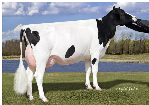
Seagull-Bay Miss America EX-91