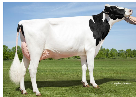
2nd dam: Speek-NT-ET VG-85