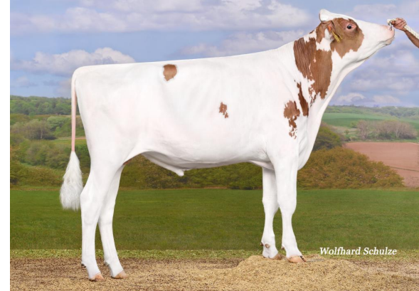
NH Sir Silky-Red