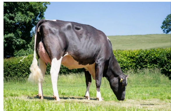
Dam: London VG-86