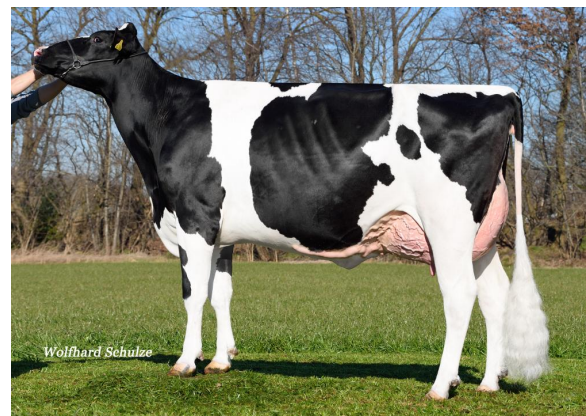
Dam: PrismaGen Dairyqueen VG-85