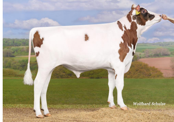
NH Evolution Skyliner-Red